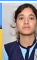
PRANJANGANGW 91 % ( COMMERCE )